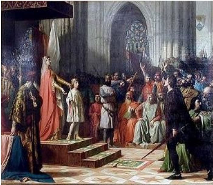
Maria van Molina presenteert haar zoon Ferdinand aan de Cortes in 1295

Maria vervulde haar rol als regentes tot 1301 toen haar zoon meerderjarig werd verklaard. De tweede periode van regentschap duurde van 1312 tot 1321. In 1312 overleed Ferdinand die zijn toen éénjarige troonopvolger en kleinkind van Maria, Alfons, de latere Alfons XI (de Rechtvaardige) aan de zorgen overliet van zijn vrouw, koningin Constanza en Maria van Molina. Maar toen Constanza ook overleed in 1319, stond Maria er weer alleen voor. In