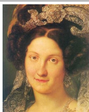
Maria Christina van Bourbon 1806-1878

Het was Filips V die de wet op de troonopvolging wijzigde en daarmee het Salische regime introduceerde: de koningin-gemalin was er alleen om troonopvolgers te baren en had geen enkel recht op de troon. In 1789 werd tijdens de regeerperiode van Karel IV besloten om terug te keren naar het traditionele stelsel van de Siete Partidas, maar de maatregel werd niet gepubliceerd. Er deden zich geen problemen voor met de opvolging en dus was er weinig behoefte dit besluit te formaliseren. In 1808 werd Karel IV opgevolgd door Ferdinand VII, waarna Napoleon Spanje binnenviel en zijn broer Jozef Bonaparte op de troon zette. De onafhankelijkheidsoorlog brak uit die door Spanje gewonnen werd met hulp van de Britten. Ferdinand VII keerde terug op de troon in 1814, waarna hij zich ging gedragen als een absoluut en repressief monarch. Hij schafte de in 1812 door liberalen geïntroduceerde grondwet (de grondwet van Cádiz) af, waarin getracht was vorm te geven aan een liberale monarchie. In deze wet werd het aloude systeem van erfopvolging met rechten voor vrouwen onderschreven.