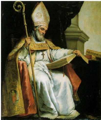
Isidoro de Sevilla 556-636

Vanaf dat moment werd de band tussen staat en kerk inniger en op den duur waren zij bijna niet meer van elkaar te onderscheiden. Er was sprake van een theocratisch regime. De kerk wist zich weliswaar ondergeschikt aan de vorst, maar deze ontleende zijn gezag aan de godheid. Het was Recesvinto die het vele wetgevende werk van zijn voorgangers en hemzelf bundelde in een Liber iudiciorum (654), de kroon op een voor die tijd in Europa ongehoorde poging om de eenheid van land en recht te doen samenvallen.