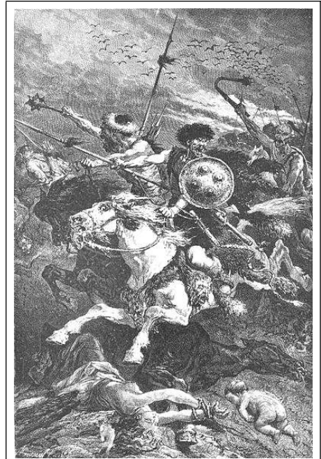
De slag bij Adrianopel in 378

Het is niet echt duidelijk waar de Visigoten vandaan kwamen. De meest gangbare theorie zegt dat zij afkomstig waren uit Scandinavië (Götland) en vanaf de eerste eeuw BC richting Donauvallei trokken waar zij tot aan 270 AC plunderingen aanrichtten in de periferie van het Romeinse rijk. In dezelfde periode trokken hun oorspronkelijke burenen, de Ostrogoten eveneens zuidwaarts en stichtten een keizerrijk in het zuiden van Rusland aan de oevers van de Zwarte Zee. Het waren de Hunnen die aan deze situatie een einde maakten door, oprukkend vanuit het oosten, rond 370 de Ostrogoten te verslaan die in zuidwestelijke richting vluchtten en zich vermengden met de Visigoten. Onder toenemende druk van de Hunnen vroegen en