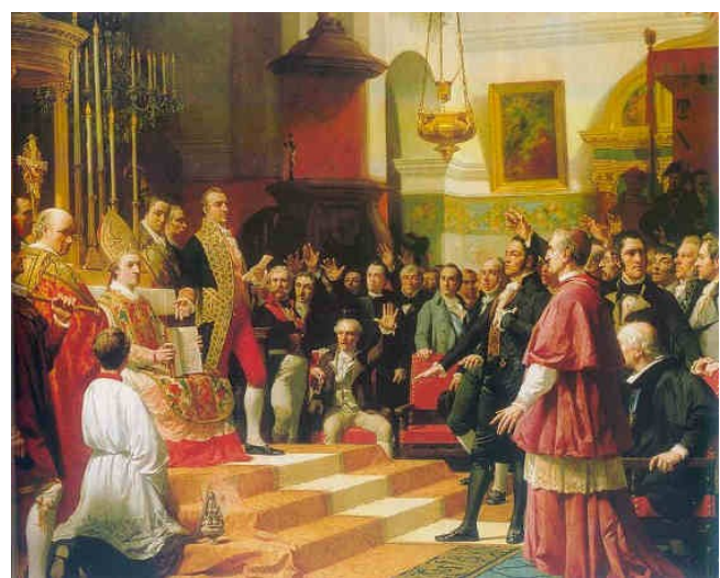
Inauguratie van de Cortes van Cádiz in 1810

De Cortes van Cádiz opereerde onder bijzondere omstandigheden, want de gang van zaken tijdens de Onafhankelijkheidsoorlog was gedurende een groot deel van de zittingsperiode beslist niet gunstig voor de revolutionairen. In feite bevond Cádiz zich tot halverwege het jaar 1812 in een geïsoleerde positie, omringd door de vijand. Maar de stad bruisde van elan en de talloze cafés en kranten boden gelegenheid aan iedereen om mee te doen aan het politieke debat. In die tijd doemde voor het eerst de term liberalismo op, een begrip dat nadien zijn weg zou vinden in andere Europese talen.