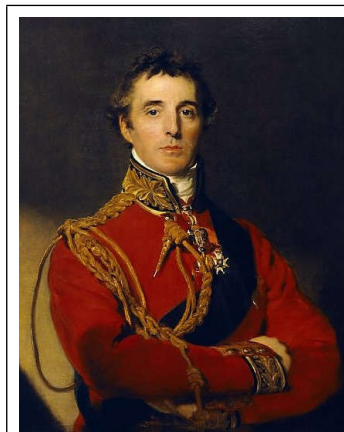
Arthur Wellesley 1769-1852

Wellesley viel de Fransen nog één keer aan en wel aan het eind van dat jaar bij San Sebastián in de slag van San Marcial en achtervolgde de Franse troepen op eigen grondgebied. De invasie van de Pruisen in Frankrijk kort daarop maakte een eind aan het Napoleontische imperium. De keizer was genoodzaakt een overeenkomst te sluiten met Ferdinand VII: het verdrag van Valençay. Daarin erkende Napoleon Ferdinand VII als rechtmatige koning van Spanje en kwam er een einde aan de Onafhankelijkheidsoorlog.