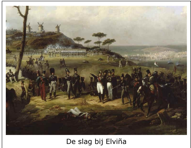
De slag bij Elviña

Ferdinand VII uit als de ware koning. Dat leidde tot een reactie en totdat de stad op 2 november definitief door de Fransen werd veroverd, ging zij zes keer in andere handen over, beleefde een revolutie, een grote veldslag en werd twee keer geplunderd. Ook in Galicië boekten de Fransen succes. Nadat in augustus 1808 het Britse leger onder aanvoering van Arthur Wellesley - de