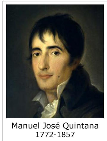
Manuel José Quintana 1772-1857

In 1809 publiceerde de schrijver Manuel José Quintana op verzoek van de Junta Suprema een manifest waarin hij uitvoerig inging op de vraag hoe de revolutie verder vorm gegeven moest worden en opriep tot het houden van verkiezingen voor de Cortes. Ook pleitte hij voor een parlementaire structuur zonder senaat, waarmee hij elke formele vorm van beïnvloeding door de aristocratie wilde uitbannen. Dat leidde tot uitvoering van een enquête aan het eind van dat jaar: de consulta al país onder kerkelijke bestuurders, autoriteiten op juridisch gebied en onder de