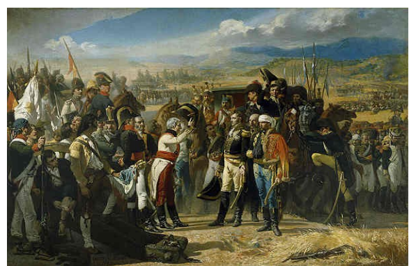
Franse overgave bij Bailén

Jaén - waar de eerste grote slag op 19 juli tussen de keizerlijke troepen en die van de opstandelingen resulteerde in een overwinning voor de Spanjaarden. Dit leger van Andalusië was op last van de Junta Suprema de Sevilla samengesteld door de ervaren generaal Francisco Javier Castaños die ook het bevel voerde. Het was tevens de eerste grote nederlaag die Napoleon Bonaparte moest incasseren en het effect van dit Spaanse succes was enorm. Niet alleen in Spanje, maar overal in Europa werd duidelijk dat de Napoleontische legers niet onoverwinnelijk waren.