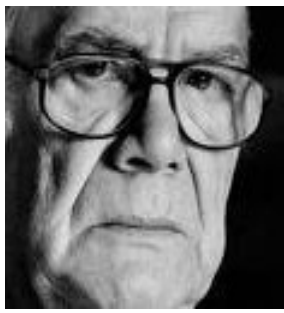
Camilo José Cela 1916-2002

Guadalajara is trots op een aantal schrijvers die er geboren zijn. In de eerste plaats natuurlijk Camilo José Cela die in 1989 de Nobelprijs voor literatuur won. Veel van zijn werk is in het Nederlands vertaald zoals De familie van Pascual Duarte en De Bijenkorf .