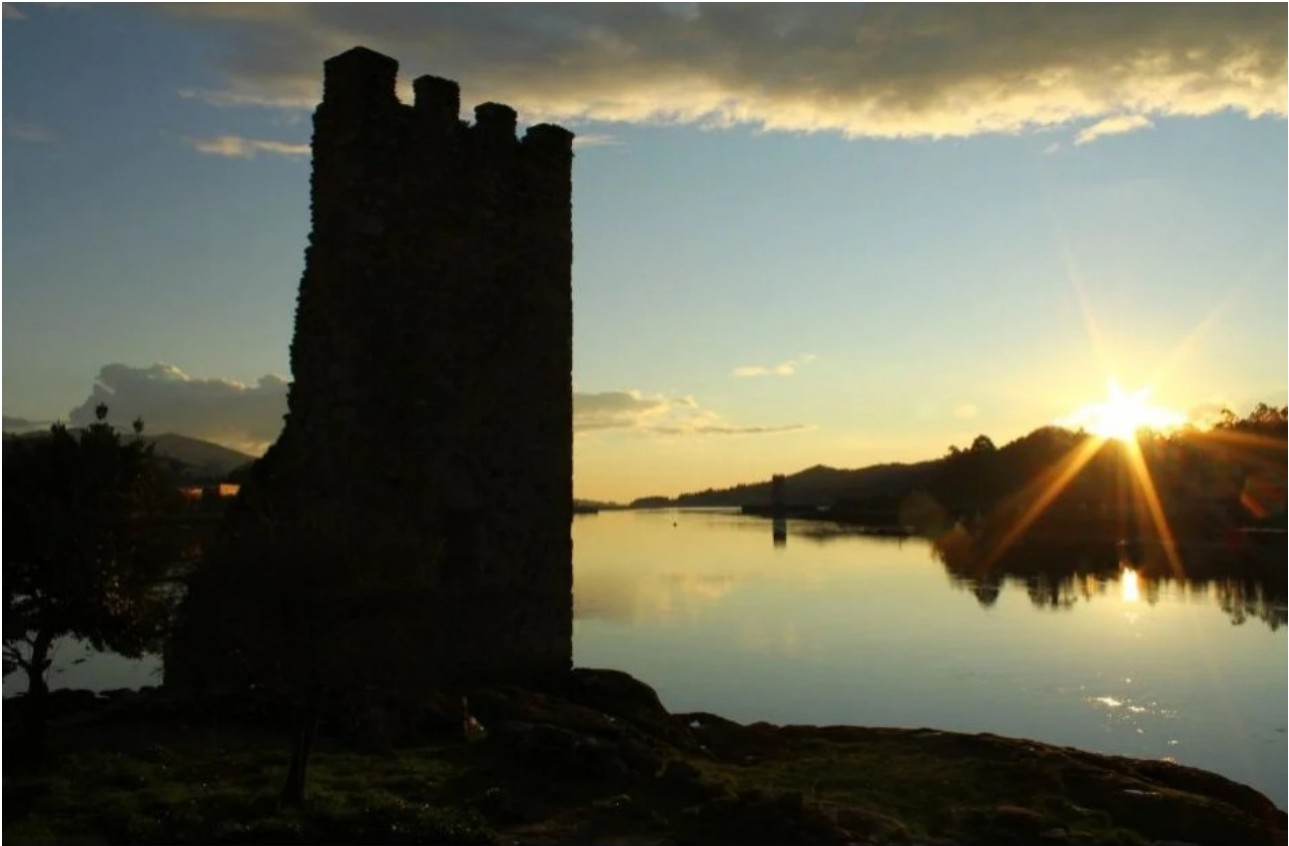
Ruïne van Torres de Oeste (CC BY-SA 2.0 - Contando Estrelas - wiki).

Daarvoor al heeft Cresconio forse maatregelen getroffen om de Galiciërs te beschermen door Santiago te voorzien van vestigwerken en het Castillo de Oeste te laten bouwen, ook wel de Torres de Oeste of Torres de Honesto genoemd. Dit verdedigingswerk is strategisch gelegen aan de rivier de Ulla nabij de plaats Catoira op de plek waar de Vikingen doorgaans proberen het binnenland te bereiken.