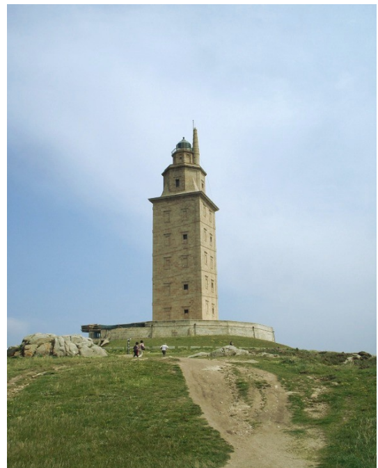
Torre de Hércules

Eind juli van het jaar 844 CE, als koning Ramiro I heerst over het Asturiaanse rijk, duiken er voor eerst Vikingschepen op voor de noordkust van Spanje. Zij hebben het kennelijk gemunt op de havenplaats Gijón, maar die is niet gemakkelijk te veroveren. Al sinds de Romeinse tijd bevindt deze stevig ommuurde nederzetting zich op het schiereiland Santa Catalina dat met zijn steile rotswand uit zee oprijst als een onneembaar bolwerk. De kronieken maken geen melding van botsingen tussen Vikingen en Asturiërs, wat overigens niet uitsluit dat de plundersaars uit het noorden voet aan land hebben gezet op beter toegankelijke plaatsen om de omgeving te verkennen, maar van schermutselingen is geen sprake. Dan zetten de Vikingen koers naar het westen waar zij zich kunnen vergapen aan het fameuze Farum Brigantium . Een vuurtoren, op last van de Romeinse keizer Trajanus gebouwd in de tweede eeuw CE op fundamenten van Fenisische ouderdom, gelegen iets ten noorden van waar nu de stad A Coruña zich bevindt. Het is de oudste werkende vuurtoren ter wereld en staat bekend als de Torre de Hércules . De huidige toren dateert uit de achttiende eeuw. Voor de Vikingen is het duidelijk, zo'n machtig bouwwerk moet wel in de buurt liggen van een belangrijke plaats, maar dat blijkt een vergissing. Het enige wat zij aantreffen is Clunia, een klein dorpje, dat niettemin grondig geplunderd wordt. In heel Galicië worden dorpjes leeggeroofd, kerken en kloosters platgebrand.