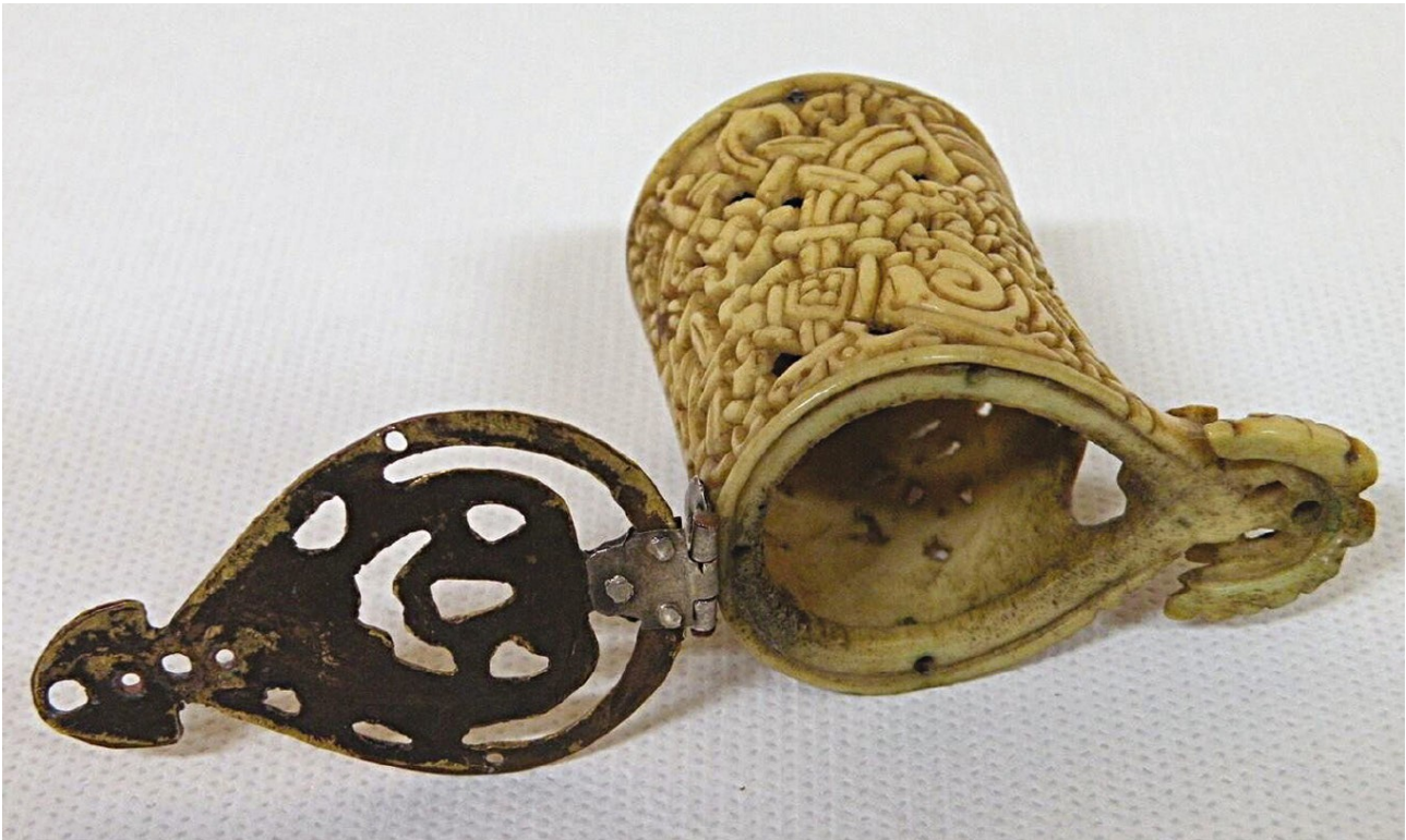
La Cajita de San Isidoro

Dit doosje is niet afkomstig uit een graf of andere archeologische vindplaats, maar gedurende eeuwen in gebruik geweest om uiteindelijk terecht te komen in het Museo de la Colegiata de San Isidoro te León.