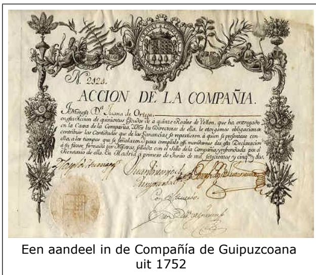
Een aandeel in de Compañía de Guipuzcoana uit 1752

Over de slavenhandel met Amerika waren in het verdrag van Utrecht in 1714 - het einde van de Spaanse Successieoorlog - afspraken gemaakt tussen Engeland en Spanje die inhielden dat Spanje aan Engeland toestond om gedurende dertig jaar tegen vergoeding een bepaald aantal slaven van Afrika naar de Spaanse koloniën te