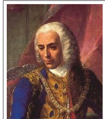
José de Carvajal 1698-1754

Rond 1750 beschikte Spanje over een leger dat qua omvang eenzesde was van dat van Frankrijk. Nog slechter was het gesteld met de marine: tegenover elk Spaans schip had Engeland er bijna negen. De plannen van Ensenada voorzagen erin deze scheve verhoudingen terug te brengen tot dat van een derde tot de helft in vergelijking met de andere mogendheden. De reorganisatie van het belastingstelsel bestond uit vervanging van provinciale inkomstenbelasting en belastingen op verbruiksmiddelen door vermogensbelasting, de Catastro . Ensenada stelde deze