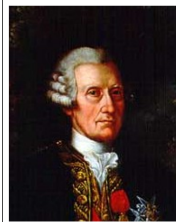
Richard Wall 1694-1777

In 1754 overleed minister Carvajal die werd opgevolgd door Richard Wall, van Ierse afkomst, die in het Spaanse leger onder Filips V had gediend en voor Ensenada diplomatieke missies uitvoerde. Vlak daarop werd de positie van Ensenada