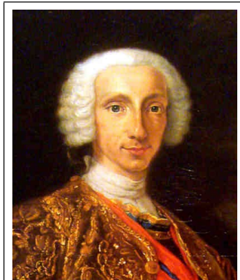
Karel III koning van Napels en Sicilië 1716-1788