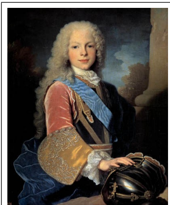
Ferdinand VI in 1725

Tegen het eind van de zeventiende eeuw begon het landsbestuur van Spanje - het ancien régime - zoals dat bestond vanaf de regeringsperiode van de katholieke vorsten Isabella I en Ferdinand II in zijn voegen te kraken. Deze bestuursvorm, een absolute monarchie steunend op de drie peilers van kerk, leger en aristocratie, had Spanje zijn gouden eeuw bezorgd, maar ook opgezaald met enorme schulden ten gevolge van de imperiale oorlogen en steeds verder verslechterende economische omstandigheden. Kritiek op deze falende vorm van bestuur kwam in de zeventiende