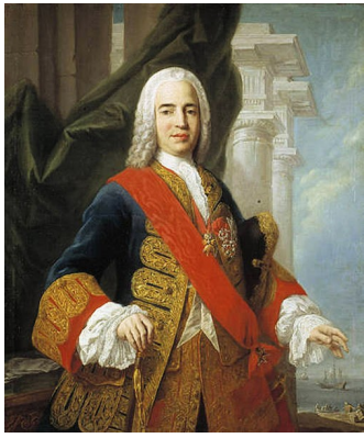
Zenón de Somodevilla Markies van Ensenada 1702-1781

Beide politici dienden al onder Filips V en kregen nu ruimte om hun herstel- en neutraliteitspolitiek gestalte te geven. In een memorandum dat Ensenada schreef in 1751 werden de lijnen geschetst die het beleid van Ferdinand VI zouden bepalen. Belangrijkste doelstellingen waren het borgen van de vrede en herstel van Spanje als serieuze speler op het wereldtoneel, handhaving van de status quo in Italië, herstel van de controle over de Amerikaanse koloniën (die ernstig te leiden hadden van de illegale handel van Engelsen en Nederlanders), handhaving van de vriendschapsbanden met