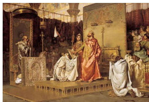
De bekeering van Reccared tot het katholicisme, Toledo 589

werden bijeengeroepen door de koning en hadden als belangrijke functie om tijdens de kroningen van de Visigotische vorsten het heilige karakter ervan te onderstrepen. Dat gebeurde in aanwezigheid van zowel de wereldlijke als de geestelijke hiërarchie, een gezamenlijk erkennen van de positie van de koning als hoofd van een confessionele staat.