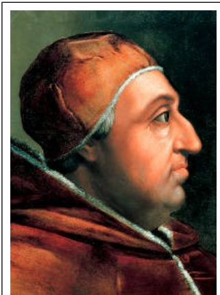
Alexander VI 1431-1503

Ferdinand en Isabella tooiden zich met de titel: katholieke vorst (rey católico) , een titel die de nauwe band aangaf tussen de monarchie en de Heilige Stoel. Deze werd hen in 1496 verleend door paus Alexander VI, die begreep dat de verbreiding van het rooms-katholieke geloof in nieuwe veroverde gebieden bij hen in goede handen was. De titel hield erkenning in door de koningen van de universele geestelijke heerschappij van het Pontificaat van Rome en