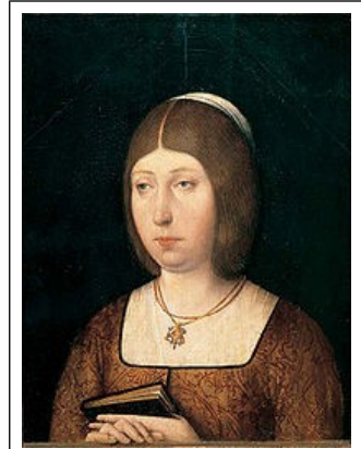
Isabella I 1451-1504

was een beloning voor de aandacht die het koningspaar toonde voor 'de verbreiding van de christelijke religie en de verheerlijking van ons heilige katholieke geloof'. Maar deze benoeming ging niet zonder discussie want sinds de dagen van Karel de Grote, mochten de Franse koningen zich de meest christelijke vorst noemen en werd Frankrijk beschouwd als hét land dat richting gaf aan de ontwikkeling van het christendom in Europa. Aan het eind van de vijftiende eeuw verkoelde de verhouding tussen Rome en Frankrijk en overwoog Alexander VI de titel van meest christelijke vorst over te dragen aan de koningen van Spanje, maar koos uiteindelijk voor de nieuwe titel van katholieke vorst. Het waren vervolgens Karel V en zijn opvolger Filips II die zich waardige dragers van deze titel toonden en gedurende de zestiende eeuw het primaat verwierven van hoeders van het rooms-katholieke geloof. De titel katholieke vorst werd gedragen door de Spaanse koningen tot aan het begin van de twintigste eeuw toen Alfons XIII afstand deed van de troon en de republiek werd uitgeroepen.