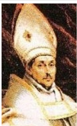
Leander van Sevilla ca 534 - 596

Het christendom deed zijn intrede tijdens de Romeinse overheersing en was mogelijk door de aanvankelijk tolerante houding die de Romeinen aanvankelijk hadden ten opzichte van spirituele stromingen uit het oosten. In elk geval ervoeren de Romeinen de komst van het christendom niet als een bedreiging. Maar gaandeweg veranderde deze houding. Aan het eind van de derde eeuw begonnen gotische stammen hun aanvallen op het Romeinse imperium en de verzwakking van het rijk die daarop volgde was voor keizer Diocletianus, die het verval toeschreef aan de opkomst van het christendom, reden om meedogenloze christenvervolgingen in te zetten. Zijn opvolger Constantijn maakte daar een einde aan en sindsdien kreeg het christendom, dat wil zeggen het rooms-katholicisme, op het Iberisch schiereiland alle ruimte.