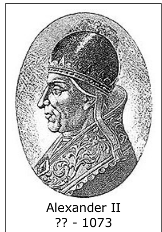
Alexander II ?? - 1073

Zoals reeds opgemerkt, lagen aan de eerste pogingen tot verovering van door Moren bestuurde gebieden niet louter religieuze motieven ten grondslag. Dat werd anders toen het concept van de religieuze oorlog opkwam met de kruistochten. Voor het eerst deed zich dit voor op Spaanse bodem in 1064, toen een internationaal leger bestaande uit Fransen, Italianen en Spanjaarden de stad Barbastro in Aragón veroverden op de Moren. Deze veldtocht, gesteund door de paus, had duidelijk het karakter van een religieuze operatie. Vanaf dat moment was het concept van de religieuze oorlog gedurende honderden jaren een belangrijke element in het denken en doen van de christelijke Spanjaarden, veel meer dan dat elders in Europa het geval was. Veel later, tijdens de Spaanse Burgeroorlog vlamde het in alle hevigheid op als motief voor de nationalistische opstandelingen, die hun strijd tegen de roden beschouwden als kruistocht om de christelijke tradities voor Spanje te behouden.