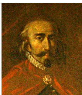
Sancho de Grote 990/92-1035

Gedurende de negende en tiende eeuw ontwikkelde de rooms-katholieke Kerk zich onder invloed van de uit al-Andalus geëmigreerde mozaraben, die goed onderlegd waren en hun stempel drukten op de christelijke identiteit. Daarbij speelden de kloosters een belangrijke rol, vooral in het agrarische en nauwelijks geurbaniseerde westen. In Asturië en Galicië nam de