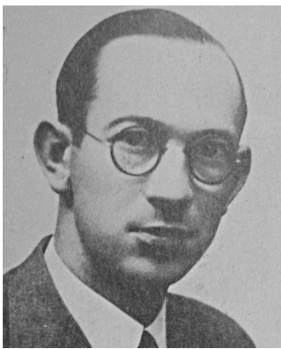
José del Castillo 1901-1936

De dertigjarige José del Castillo was luitenant in dienst van de Guardia de Asalto , een politiekorps dat in 1932 was opgericht door de links-republikeinse regering om de orde te bewaren in de steden. Leden van dit corps waren loyaal aan het regime in tegenstelling tot de leden van de uit 1844 stammende Guardia Civil , een corps dat door links gehaat werd. Op de avond van 12 juli 1936 nam Castillo afscheid van zijn vrouw met wie hij anderhalve maand daarvoor in het huwelijk was getreden en begaf zich op weg naar het Plaza de Pontejos nabij de Puerta del Sol in het centrum van Madrid, om zijn