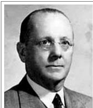
José Giral 1878-1962

Mede op verzoek van Negrín kwam de Spaanse Cortes in ballingschap bijeen op 1 augustus 1945. Dat gebeurde in het Paleis voor Schone Kunsten in Mexico-Stad, dat voor die gelegenheid tot extraterritoriaal terrein was verklaard. Negrín verdedigde daar zijn optreden en sprak de hoop uit dat de later op te richten Verenigde Naties de regering in ballingschap zou erkennen en pogingen in het werk zou stellen om Franco te verdrijven. Negrín diende zijn ontslag in waarop president Barrio niet hem benoemde tot formateur, maar José Giral die een kabinet formeerde zonder Negrín. Daarmee was de breuk tussen Negrín en het politieke establishment van de Spaanse ballingen compleet. Wel probeerde Negrín zijn relatie met Prieto te herstellen, maar het was tevergeefs. Moegestreden vestigde Negrín zich in Parijs. Hij bezocht af en toe