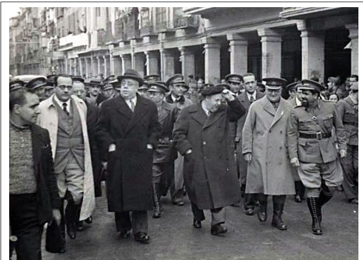
Negrín (2e vl.), Azaña en Prieto in Madrid 1937

President Azaña zag in dat in de strijd tegen Franco de eenheid in het links-republikeinse kamp bewaard diende te worden. Hij droeg daarom aan de socialist Largo Caballero op een regering te formeren bestaande uit vertegenwoordigers van het Volksfront. In dit kabinet bezette Negrín de post van Financiën. Spanje beschikte over een enorme goudvoorraad die opgeslagen lag in de kluizen van de centrale bank te Madrid en omdat deze stad bedreigd werd door de militaire opstandelingen besloot de regering op initiatief van Negrín het goud te verplaatsen naar Cartagena. Maar Negrín ging een stap verder. Om het goud veilig te stellen en wapens te kopen, liet hij - met toestemming van de premier - de voorraad verschepen naar Rusland dat onmiddellijk begon met grote wapenleveranties. Negrín kon niet anders, want van de westerse mogendheden had hij niets te verwachten. Met dit initiatief legde Negrín een grote vastberadenheid aan de dag, ondanks de grote verliezen die de republikeinen leden aan het begin van de Burgeroorlog. Dat de republikeinen zich hiermee afhankelijk maakten van de Sovjet Unie lijkt geen twijfel en ook al omdat de