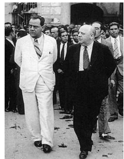
Negrín (l) en Prieto

Negrín beschikte over financiële middelen in de Verenigde Staten en Groot-Brittannië en besloot in 1940 Frankrijk te verlaten om zich in Londen te vestigen. Hij had op eigen kosten een schip geregeld dat hem tezamen met enkele wetenschappers en journalisten naar Engeland zou brengen. Hij bood de eveneens naar Frankrijk uitgeweken ex-president Azaña en partijgenoot Largo Caballero - die in Parijs woonde - aan om mee te gaan. Azaña was te ziek en zou kort daarna overlijden. Largo Caballero nam het risico te blijven en werd later opgepakt door de Gestapo. Eenmaal in Londen presenteerde Negrín zich als wettig premier van de Spaanse regering in ballingschap, vergelijkbaar met de positie van de uitgeweken Nederlandse regering. Maar het kabinet van Negrín werd door de regering Churchill niet erkend als regering in ballingschap. Nog geen maand na Negríns aankomst in Londen werd duidelijk dat het franquistische regime pogingen in het werk stelde om Negrín te laten uitwijzen. Labourleider Attlee stelde Negrín voor naar de Verenigde Staten te gaan, maar dat land wilde daar niets van weten. Ook pogingen om Negrín naar Canada of Mexico te laten verhuizen liepen op niets uit. Het franquistische regime uitte een stroom van beschuldigingen aan het adres van Negrín. Hij zou er met de Spaanse schatkist vandoor zijn gegaan en zijn landgenoten aan hun lot hebben overgelaten. Beschuldigingen die door het Britse Ministerie van Buitenlandse zaken niet werden weersproken.