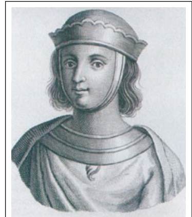
Berenguela van Castilië 1180-1246

De persoonlijke breuk tussen Berenguela en Alfons IX bracht de rechten van zoon Ferdinand niet in gevaar, hoewel Alfons probeerde de Leonese troon in handen te spelen van zijn dochter Sancha (uit zijn eerder huwelijk met Theresia van Portugal). Door toedoen van Berenguela mislukte dit. Berenguela vervulde dus een belangrijke rol in de vereniging van de koninkrijken van Castilië en León, geen geringe zaak voor een vrouw die slechts was opgevoed om de traditionele rol te vervullen als echtgenote. Dankzij haar politieke inzicht, haar doorzettingsvermogen en heldere kijk op de betekenis van het verenigde rijk van Castilië en León, werd Ferdinand III in 1230 bezitter van deze troon. Daarmee was de basis gelegd voor het ontstaan van het koninkrijk van Spanje in 1516, waarvan ook Navarra en Aragón deel uitmaakten.