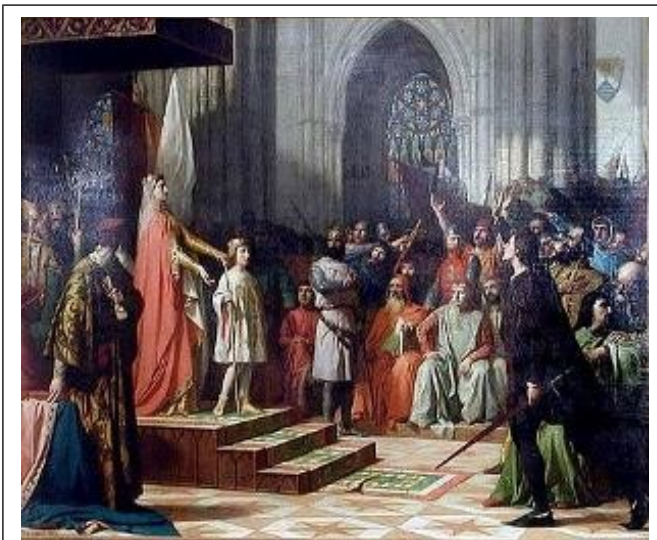
Maria van Molina presenteert haar zoon Ferdinand aan de Cortes in 1295

Gedurende de regeringsperiode (1252-1284) van Alfons X werden de zogeheten Siete Partidas of kortweg Partidas (akten) opgesteld, een stelsel van wetten waarin regels waren opgenomen om een zekere juridische uniformiteit te bewerkstelligen in het koninkrijk. In de Partidas werden onder meer de rechten geregeld van de regerend koningin en rechten die in het algemeen waren toegekend aan de koning en bij ontstentenis van hem aan de koningin. Op dit punt was Spanje dus aanmerkelijk liberaler dan Frankrijk waar vrouwen waren uitgesloten van elke politieke functie. De Partidas bleven tot in de negentiende eeuw van kracht.