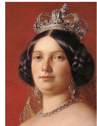
Isabella II 1830-1904

In 1846 huwde Isabella op aandringen van haar moeder met Frans van Assisi. Uit dit huwelijk werden twaalf kinderen geboren waaronder Alfons XII in 1857. Geen goed huwelijk overigens en Isabella schijnt er tal van minnaars op na te hebben gehouden. Zij regeerde vijfendertig jaar en er verschenen drie grondwettelijke teksten onder haar verantwoordelijkheid. Haar promiscue escapades gaven aanleiding tot grappen en pornografische uitingen. Ook kende haar regeerperiode tal van politieke en antiklerikale, sociale en economische conflicten. In 1868 was de maat vol en brak een revolutie uit die een eind maakte aan haar regeerperiode. Isabella verhuisde naar Parijs waar ze in 1874 de restauratie van de troon door Alfons XII mocht meemaken. Ze overleed in 1904.