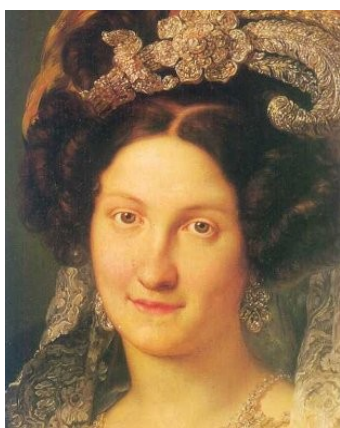
Maria Christina van Bourbon 1806-1878

In 1808 werd Karel IV opgevolgd door Ferdinand VII, waarna Napoleon Spanje binnenviel en zijn broer Jozef Bonaparte op de troon zette. De onafhankelijkheidsoorlog brak uit die door Spanje gewonnen werd met hulp van de Britten. Ferdinand VII keerde terug op de troon in 1814, waarna hij zich ging gedragen als een absoluut en repressief monarch. Hij schafte de in 1812 door liberalen geïntroduceerde grondwet (de grondwet van Cádiz) af, waarin getracht was vorm te geven aan een liberale monarchie. In deze wet werd het aloude systeem van erfopvolging met rechten voor vrouwen onderschreven.