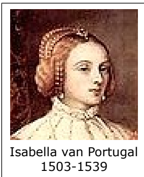
Isabella van Portugal 1503-1539

Isabella van Portugal ofwel Isabella van Avis en Trastámara, was de echtgenote van Karel V, en ofschoon het huwelijk om politieke redenen werd gesloten, waren zij zeer gelukkig met elkaar. Zij werd geen koningin van Spanje omdat Johanna I van Castilië, regerend koningin, nog leefde. Isabella is een goed voorbeeld van iemand die als vrouw van een vorst het regentschap uitoefende in afwezigheid van de vorst.