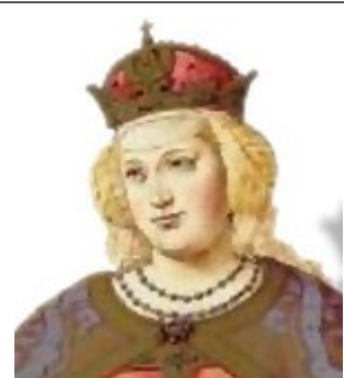
Urraca I van León 1081-1126

In het koninkrijk van Castilië en León was de situatie anders. Daar werd de Visigotische traditie voortgezet en trad Urraca, dochter van koning Alfons VI, op als regerend vorstin van 1109 tot 1126. In 1109 huwde zij met Alfons I de van Aragón naar wens van haar vader, Alfons VI, die in deze verbinding en versteviging zag van de dynastieke rechten. Maar het was een slecht huwelijk en het werd in 1114 zelfs officieel ontbonden. Gedurende deze periode bleek dat hoewel Urraca de volledige rechten bezat op de troon, zij toch een mindere positie innam dan wanneer zij een man zou zijn geweest. Alfons trok veel macht naar zich toe en noemde zich zelfs keizer van geheel Spanje. Bovendien werd bij het huwelijk bepaald dat Alfons de domeinen in bezit zou krijgen van zijn overleden schoonvader die weer teruggegeven zouden worden aan Urraca wanneer aan het huwelijk een eind zou komen, hetgeen geschiedde. Gedurende haar gehele regeringsperiode voerde zij oorlog met haar ex-man, maar wist zich met behulp van haar zoon en opvolger Alfons VII goed te handhaven.