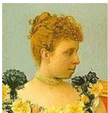
Maria Christina van Oostenrijk 1858-1925

In 1878 huwde Alfons XII Maria Christina, aartshertogin van Oostenrijk. Dit huwelijk duurde tot november 1885, toen Alfons overleed. Uit het huwelijk waren twee dochters geboren en toen Alfons stierf was Maria Christina zwanger. Dit bracht een ongekende situatie met zich mee. Wanneer de nakomeling een meisje zou zijn, zou het geen probleem opleveren om de eerstgeborene uit te roepen tot erfopvolgster, maar wanneer dat gedaan zou zijn en de nakomeling bleek een jongetje, zou er een ernstig belangenconflict ontstaan en juridisch moeilijk de aanwijzing van de eerstgeborene ongedaan te maken. Dus werd besloten de geboorte af te wachten. Het werd een zoon, Alfons XIII en Maria Christina werd regentes totdat Alfons meerderjarig werd verklaard in 1902. Zij was een bijzondere vrouw en werd wel doña Virtudes (de deugdzame) genoemd. Ze stierf in 1929 en de ondergang van de monarchie in 1931 maakte ze dus niet meer mee.