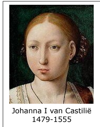
Johanna I van Castilië 1479-1555