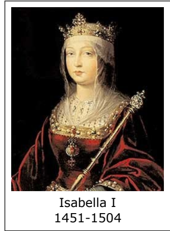
Isabella I 1451-1504

In 1479 werd Isabella regerend koningin van Castilië. Met haar man Ferdinand maakte zij strikte afspraken: in het Concordaat van Segovia werd de gelijkwaardigheid van koning en koningin erkend: de duale monarchie van Castilië en Aragón was geboren. Isabella en Ferdinand zouden de geschiedenis ingaan als de Reyes Católicos (katholieke koningen), vanwege hun intense geloofsijver die onder andere leidde tot uitwijzing van de Joden en de Moriscos, de tot het christendom bekeerde Moren.