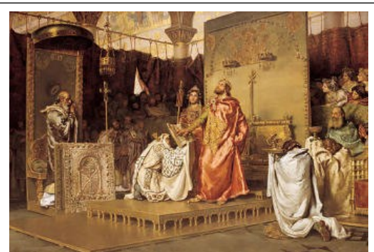
De bekering van Baddo en Reccared tot het katholicisme, Toledo 589

het arianisme te verdedigen tegenover het katholicisme. En later was er koningin Baddo die met haar man Reccared, zoon uit een eerder huwelijk van Leovigild, precies het tegenovergestelde deed als haar stiefmoeder Goiswintha: zij trad openlijk op als verdediger van het katholieke geloof en zwoer met haar man het arianisme af tijdens het concilie van Toledo in 589.