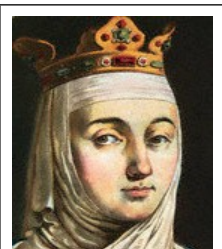
Brunhilde 534 - 613

De Visigoten kenden in oorsprong niet het systeem van erfelijke troonopvolging. Bij overlijden van de koning koos de adellijke elite een nieuwe vorst uit haar midden. Maar dat systeem werd geleidelijk aan vervangen door erfopvolging, wat voortvloeide uit de wens van heersende monarchen om de macht van hun clans te consolideren. Met deze ontwikkeling groeide de betekenis van de koningin als degene die de troonopvolger voortbrengt, maar hun werd niet het vermogen toegekend om zelf te kunnen regeren en opvolging geschiedde dus via de mannelijke lijn. Tenzij er geen mannelijke troonopvolger was en in dat geval kon een uitzondering worden gemaakt. Dit in tegenstelling tot regels die de Franken daarover hadden vastgelegd in de zogenaamde Salische wetten die vrouwen geen enkel recht toekenden.