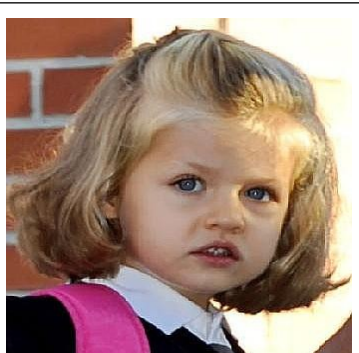
Leonor van Bourbon 2005 -

Bij de dood van de huidige koning van Spanje, Juan Carlos I *), door Franco aangewezen als zijn opvolger als staatshoofd, zal hij niet door zijn oudste nazaat, dochter Elena, worden opgevolgd zoals dat in Nederland het geval zou zijn, maar door de na Elena geboren zoon