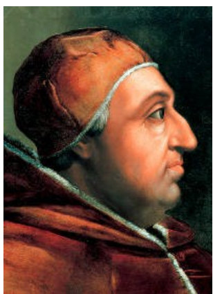
Alexander VI 1431-1503

Ferdinand en Isabella tooiden zich met de titel: katholieke vorst (rey católico) , een titel die de nauwe band aangaf tussen de monarchie en de Heilige Stoel. Deze werd hen in 1496 verleend door paus Alexander VI, die begreep dat de verbreiding van het rooms-katholieke geloof in nieuwe veroverde gebieden bij hen in goede handen was.