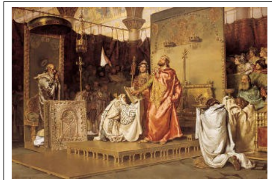
De bekering van Reccared tot het katholicisme, Toledo 589

Het is vanaf dat moment dat sprake is van een hechte band tussen de Spaanse koningshuizen en de Heilige Stoel, een band die bijna veertien eeuwen zou standhouden. Maar al vanaf het begin van deze relatie tekende zich het primaat van de monarchie af over de Kerk. Concilies als die van Toledo in 589 werden bijeengeroepen door de koning en hadden als belangrijke functie om tijdens de kroningen van de