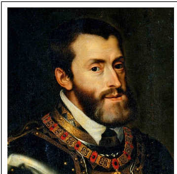
Carlos I 1500-1558

Felipe II van Spanje heeft zijn hele leven besteed aan de verdediging van het rooms-katholieke geloof. Dat was zijn belangrijkste motief om te vechten tegen de Ottomanen in het Middellandse Zeegebied en voor zijn enorme militaire inzet in de Nederlanden. Deze en andere krijgshandelingen kostten Spanje veel geld dat deels door het innen van directe en indirecte belastingen werd opgebracht en deels door de heffingen op de zilverimporten uit Amerika. Zilver werd in Amerika voor het overgrote deel door private ondernemingen gewonnen en naar Sevilla verscheept. Twintig procent van de opbrengst hiervan vloeide in de schatkist. De belangrijkste bron van