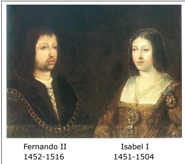
Fernando II 1452-1516

Het Spaanse rijk waarover Felipe II regeerde was ontstaan door de vereniging van de kronen van Castilië en Aragón (waartoe ook Catalonië en Valencia behoorden) toen de Castiliaanse koningin Isabel I in 1469 huwde met de Aragonese vorst Fernando II. Fernando voegde in 1516 het kleine koninkrijk Navarra onder de Castiliaanse kroon