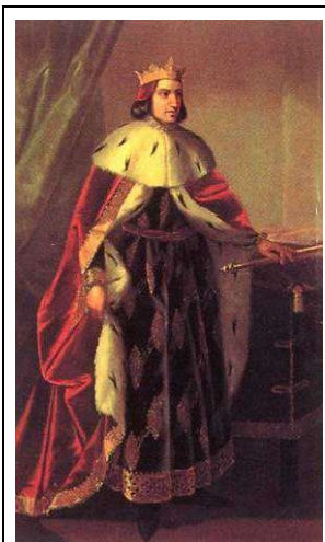
Martín I van Aragón

Zijn opvolger, Alfonso X, koning van Castilië van 1252 tot 1284, werd geëerd als El Sabio , De Wijze. Deze bijnaam kreeg hij vanwege zijn ijver om de grootste geleerden van zijn tijd, onder wie Joden en Arabieren, te bewegen zich te vestigen in de Spaanse steden Murcia, Sevilla en Toledo. Deze koning was een groot begunstiger van kunsten en wetenschappen en hij maakte de belangrijkste steden van Castilië tot centra van beschaving, schakels tussen de oosterse wetenschappen en de Europese cultuur.