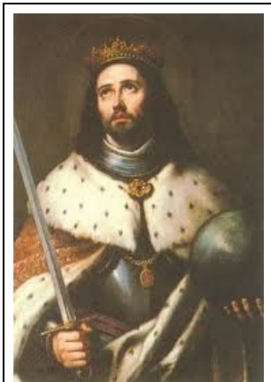
Fernando III van Castilië