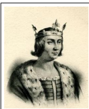
Luis I van Navarra

Pejoratieve bijnamen werden evenmin geschuwd. Soms waren die alleen bij de tegenstanders van een vorst in gebruik, bijvoorbeeld de bewoners van een veroverd gebied, soms ook bij de eigen onderdanen, als hun koning niet geliefd was. Ordoño IV, die in 958 de troon van León ontroofde aan Sancho I, maar al twee jaar later op zijn beurt door zijn rivaal werd afgezet, werd zonder omwegen El Malo genoemd, in het Nederlands: De Boze, eigentijdser: De Schurk of De Duivel.