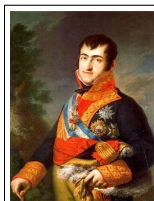
Fernando VII van Spanje

De zoon van Carlos IV, Fernando VII van Spanje, zat in 1808 enkele maanden op de troon en vervolgens van 1814 tot 1833. Zijn twee bijnamen luidden El Deseado en El Rey Felón , respectievelijk De Gewenste en De Verrader. Als jong vorst was deze koning zeer geliefd bij het volk. Hij was de eerste koning na het verdrijven van de gehate José Bonaparte. Al snel na zijn kroning ontwikkelde hij zich echter tot een absolutistisch vorst die zelfs de Grondwet van Cádiz afschafte. De Verrader slaat zowel op het hem door zijn tegenstander Manuel de Godoy aangerekende hoogverraad, waarvoor hij in 1807 gearresteerd werd, als op het verraad van zijn medeplichtigen dat hij daarna volgens de kroniek pleegde. Zo kan het bij koningen uit het verleden verkeren.