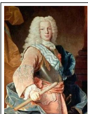
Fernando VI van Spanje

Martín I van Aragón regeerde van 1356 tot 1410 en werd beschouwd als een uitermate beschaafd en intelligent man, een typische Renaissancekoning, en daarom el Humano genoemd. In het Nederlands werd de bijnaam vertaald als De Menselijke, nu misschien liever te vertalen als De Humanist. Omdat zijn oudste zoon ook Martín heette, kreeg hijzelf later als tweede bijnaam El Viejo , De Oude.