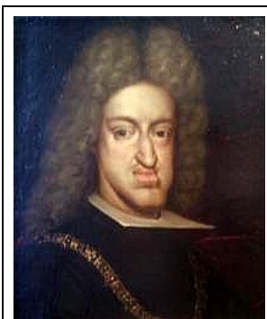
Carlos II van Spanje

Ook beklagenswaardig was Koning Carlos II, die in naam over Spanje, de Zuidelijke Nederlanden, Napels en Sicilië regeerde van 1665 tot 1700, maar in feite niet tot regeren in staat was. Hij werd El Hechizado genoemd, wat in het Nederlands vertaald werd als De Behekste. Hij was namelijk zowel geestelijk als lichamelijk ernstig gehandicapt, hoogstwaarschijnlijk tengevolge van degeneratie door inteelt binnen zijn familie, de Habsburgers, maar volgens het geloof van die tijd door behekking. Tevergeefs traden vele exorcisten aan. De arme Carlos werd tweemaal uitgehuwelijkt, maar bleef kinderloos en met hem stierf in 1700 de Spaanse tak van het Huis van Habsburg uit.