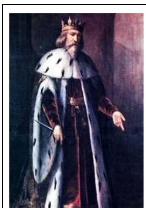
Pedro IV van Aragón

Pedro I, koning van Castilië van 1350 tot 1369 met een korte onderbreking in 1367, werd zowel El Cruel als El Justiciero genoemd, De Wrede en tegelijk De Rechtvaardige. Zijn halfbroer, Enrique II van Castilië (1369-1379), heette enerzijds el Fratricida , de Broedermoordenaar, omdat hij, hoewel hij een bastaard was, op de troon kwam nadat Pedro I, vermoord was, anderzijds El de las Mercedes , vanwege de gunsten die hij daarna aan zijn trouwe vazallen verleende als erkenning voor hun bewezen verdiensten.