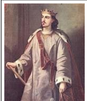
Alfonso III van Aragón