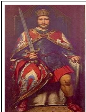
Sancho I van León

Net als bij eenvoudiger stervelingen gaven ook bij monarchen opvallende lichamelijke kenmerken of gebreken gemakkelijk aanleiding tot bijnamen. Ook toegeschreven psychische eigenschappen leidden tot spottende bijnamen.