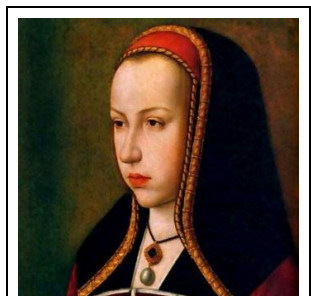
Juana van Castilië

Tragisch was het leven van Juana van Castilië, die in naam van 1506 tot 1555 koningin van Castilië en León was, maar door haar omgeving krankzinnig werd genoemd. Ze bracht decennialang in gedwongen eenzame opsluiting door en werd bekend als Juana la Loca , vertaald als Johanna de Waanzinnige. Zowel bij de bijnaam als bij de vertaling is wel een vraagteken te plaatsen: was zij niet eerder een slachtoffer van politieke intriges? En klinkt 'Gekke Juana' niet echter?