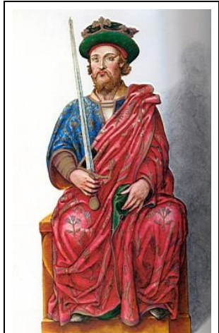
Fernando IV van Castilië