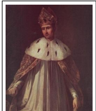
Ramiro II van Aragón

De bijnaam van Ramiro II (1134-1157) van Aragón luidde El Monje , De Monnik. Deze koning werd op zeer jeugdige leeftijd toevertrouwd aan een klooster in Zuid-Frankrijk, werd abt van een klooster in Huesca en later bisschop. Zijn broer, koning Alfonso I, legde vast dat na zijn dood het koninkrijk toe zou komen aan enkele militaire ordes, maar daarmee namen de edelen geen genoegen. Zij haalden na het overlijden van Alfonso zijn broer Ramiro uit het klooster en plaatsten hem op de troon. Na zijn troonsafstand ten gunste van zijn dochter Petronila keerde Ramiro toch weer terug naar het religieuze leven.