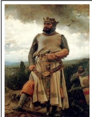
Alfonso I van Aragón, de Strijdlustige

Fernando III (1217-1252) van Castilië en León werd om zijn vele schenkingen aan de katholieke Kerk en zijn niet-aflatende inspanningen ter verbreiding van de christelijke invloedssfeer eeuwen later heilig verklaard. Dat gebeurde door Paus Clemens X in 1671 en sindsdien werd hij Fernando el Santo of San Fernando genoemd. In 1810 werd hij door Fernando IV van Napels nog extra gelauwerd met het instellen van een ridderorde met hun beider naam.