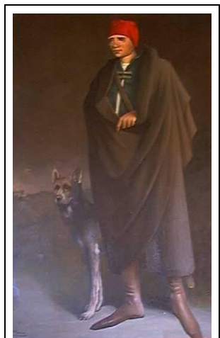
Enrique IV van Castilië

García II el Temblón , koning van Navarra van 994 tot 1004, dankte zijn bijnaam, vertaald als De Sidderende, aan het feit dat hij altijd stond te trillen voordat hij het slagveld betrad. Uit kronieken blijkt dat hij niet beefde van angst maar van ongeduld en strijdlust, dus eigenlijk is zijn gedrag als gretig popelen te bestempelen.