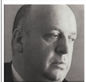
Indalecio Prieto 1883-1962

Met José Antonio als gekozen parlementariër werd de stem van de Falange gehoord in de Cortes. Hij was en bleef een eenling, want de Falange sloot zich niet aan bij welke rechtse groepering dan ook. Af en toe hield José Antonio doorwrochte redevoeringen die eerder een academisch dan een politiek karakter hadden. Hij bereikte er weinig tot niets mee. Geagiteerd reageerde hij op aanvallen van links op het beleid van zijn vader. Toen Indalecio Prieto zijn vader beschuldigde van systematische diefstal tijdens diens dictatuur, ontstak José Antonio in woede en wilde hij Prieto te lijf gaan. Dit kon worden voorkomen. Het was diezelfde Prieto die