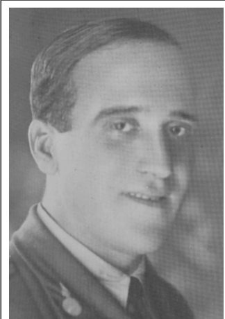
Julio Ruiz de Alda 1897-1936

Enkele weken later lanceerden de MES-leiders in het Teatro de la Comedia in het centrum van Madrid de beweging als een reguliere partij. De naam van de beweging werd veranderd in een meer aansprekende: Falange Español (F.E.). De afkorting F.E. was niet nieuw en stond oorspronkelijk voor Frente Español (Spaans Front). Dit was een kleine en weinig levensvatbare