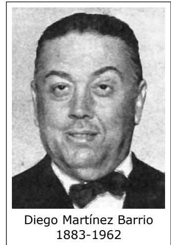
Diego Martínez Barrio 1883-1962