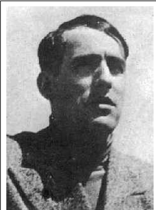
Ramiro Ledesma Ramos 1905-1936

Medio maart 1931 publiceerde Ledesma samen met enkele geestverwanten het eerste exemplaar van het blad La Conquista del Estado (De Verovering van de Staat), een manifest waarin onder meer jongeren werden opgeroepen militante eenheden te vormen die het geweld niet schuwden. Burgermilities die het bourgeois-denken en het antimilitarisme bestrijden.