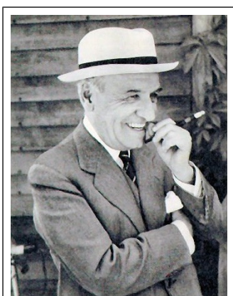
José Ortega y Gasset 1883-1955

Het waren deze noties die tot de verbeelding spraken van José Antonio, een man die beslist geen origineel denker was. Net als Ortega beschouwde hij de natie als een onderneming en verwierp hij elke vorm van regionaal-nationalisme. Daarnaast was José Antonio overtuigd rooms-katholiek en een bewonderaar van het leger. Religie en militarisme waren in zijn ogen de enige twee wegen waarlangs het levenspad serieus bewandeld kon worden. En wat voor een individu gold, gold ook voor de natie. Opmerkelijk is zijn verheerlijking van het landleven. De plattelander was volgens José Antonio moreel superieur aan de industriearbeider die vergiftigd zou zijn door verkeerde - linkse - denkbeelden. Het is dan ook niet vreemd dat de Falange haar propaganda in eerste instantie richtte op de minst ontwikkelde delen van het land. In de denkwereld van het ontluikend Spaanse fascisme speelde het concept van het imperium een grote rol. Niet zozeer in letterlijke zin - het Spaanse imperium was met de nederlaag in 1898 verloren en er waren geen