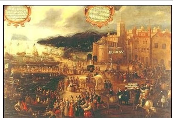
Inscheping van de moriscos te Valencia 1609

wordt aangeduid met de term taqiyya . Niettemin werd de gedwongen doop veelvuldig toegepast, wat zeer tegen de zin was van de landeigenaren, want door de doop kregen de 'bekeerde' moriscos dezelfde status als christen-arbeiders die nu eenmaal veel beter betaald moesten worden. Uiteindelijk werd na een eeuw van gedwongen bekeerlingen en een aantal opstanden in Granada (1499) in Valencia (1520) en in de Alpujarras (1578) in 1609 door Filips III besloten de moriscos het land uit te zetten, een besluit dat mede ingegeven was door de hardere opstelling van bestuurders ten gevolge van het al maar niet onder controle krijgen van de opstand in de Lage Landen. Het proces van uitwijzing duurde vier jaar en betekende met name voor het País Valenciano een geduchte economische aderlating.