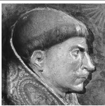
Francisco de Cisneros 1436 - 1517

procent uit van de totale bevolking. Deze bekeerlingen bezaten de armste gronden en leefden vaak in de periferie van de steden. Zij werden in religieus opzicht niet voor vol aangezien en gediscrimineerd. Ze waren immers bekeerlingen die dikwijls vasthielden aan islamitische gebruiken. In een economische situatie waarin er eenvoudigweg niet voldoende geproduceerd werd om in de vraag naar economische goederen te voorzien, gaf dat aanleiding tot grote sociale spanningen en voor zover dat mogelijk was emigreerden de moriscos naar het nabij gelegen en nog steeds in Moorse handen zijnde koninkrijk van Granada dat in 1495 door de katholieke koningen Isabella (Castilië en León) en Ferdinand (Aragón), waarmee de herovering (Reconquista) van Spanje op de Moren een feit was. Daarna was emigratie voor de moriscos natuurlijk veel lastiger. De moriscos werd overigens de hand boven het hoofd gehouden door hun bazen die economisch voordeel putten uit deze goedkope arbeidskrachten.