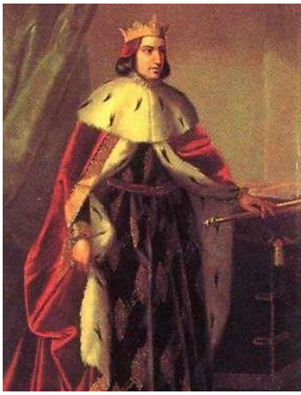
Martin I van Aragón De Humanist

Martín I van Aragón regeerde van 1356 tot 1410 en werd beschouwd als een uitermate beschaafd en intelligent man, een typische Renaissancekoning, en daarom el Humano genoemd. In het Nederlands werd de bijnaam vertaald als De Menselijke, nu misschien liever te vertalen als De Humanist. Omdat zijn oudste zoon ook Martín heette, kreeg hijzelf later als tweede bijnaam El Viejo , De Oude.