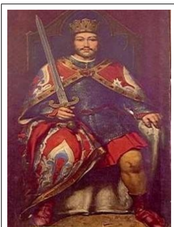
Sancho I van León De Dikzak

Sancho I van León, die met twee jaar onderbreking regeerde van 956 tot 966 over het koninkrijk León, was zo zwaarlijvig dat hij niet zonder hulp een paard kon bestijgen, wat in die tijd van voortdurend strijdgewoel natuurlijk een forse handicap was. Hij werd door zijn rivaal Ordoño IV el Malo van de troon gestoten. Zijn bijnaam luidde