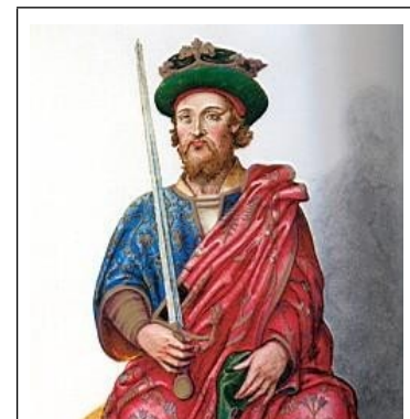
Fernando IV van Castilië De Gedagvaarde

Alfonso II, van 1164 tot 1196 koning van Aragón, de kleinzoon van Ramiro de Monnik, kreeg de suggestieve bijnaam El Casto , De Kuise. In tegenstelling tot wat zijn bijnaam doet vermoeden, verwekte hij acht kinderen bij Sancha van Castilië, met wie hij in 1174 in Zaragoza in het huwelijk was getreden. Naar verluidt had hij echter geen buitenechtelijke kinderen, wat opmerkelijk was voor die tijd.