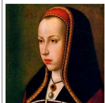
Juana van Castilië De Waanzinige

García II el Temblón , koning van Navarra van 994 tot 1004, dankte zijn bijnaam, vertaald als De Sidderende, aan het feit dat hij altijd stond te trillen voordat hij het slagveld betrad. Uit kronieken blijkt dat hij niet beefde van angst maar van ongeduld en strijdlust, dus eigenlijk is zijn gedrag als gretig popelen te bestempelen.