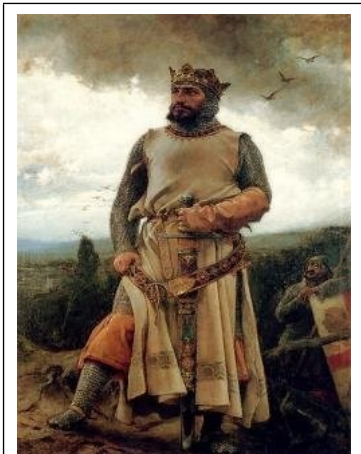
Alfonso I van Aragón De Strijdvaardige

Lange tijd heerste in Nederlandse geschiedenisboeken de gewoonte om buitenlandse eigennamen te vertalen, wat merkwaardige resultaten opleverde, omdat voor sommige voornamen moeilijk een equivalent te vinden was. Zo trof de lezer dan op de lijst van Spaanse koningen tussen alle Alfonsen en Ferdinands ineens een kennelijk onvertaalbaar