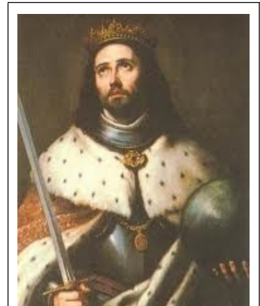
Fernando III van Castilië De Heilige

Fernando III (1217-1252) van Castilië en León werd om zijn vele schenkingen aan de katholieke Kerk en zijn niet-aflatende inspanningen ter verbreiding van de christelijke invloedssfeer eeuwen later heilig verklaard. Dat gebeurde door Paus Clemens X in 1671 en sindsdien werd hij Fernando el Santo of San Fernando genoemd. In 1810 werd hij door Fernando IV van Napels nog extra gelauwerd met het instellen van een ridderorde met hun beider naam.