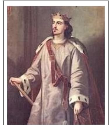
Alfonso III van Aragón De Vrijgevege

Dikwijls was de bijnaam van een vorst vleidend bedoeld en werd die vooral door de edelen aan hun heer toegekend. Meer dan één koning werd gestreeld met een bijnaam als El Grande , El Conquistador (De Veroveraar) of El Batallador (De Strijdvaardige). Koning Alfonso III van Aragón, wiens regeerperiode slechts van 1285 tot 1291 duurde, werd geëerd met de bijnaam El Franco , De Vrijgevege, om zijn gulle houding tegenover zijn vazallen. Op Majorca en Ibiza, eilanden die hij met aanvallen bestookte en uiteindelijk veroverde, zal men die kwalificatie niet van harte onderschreven hebben.