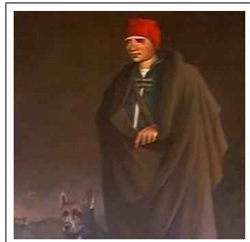
Enrique IV van Castilië De Impotente

Navrant is het verhaal van Enrique IV, van 1454 tot 1474 koning van Castilië: zijn bijnaam was El Impotente , in preutse tijd in het Nederlands vertaald als De Machteloze. Hij trouwde in 1440 met zijn twaalfjarige nichtje Blanca II van Navarra, als bezegeling van een vier jaar eerder gesloten vredesverdrag tussen Navarra en Castilië. Bij pauselijk besluit werd dit huwelijk dertien jaar later ontbonden, nadat officieel de maagdelijkheid van Blanca was aangetoond. Enrique werd officieel impotent verklaard, waarmee zijn tegenstrevers een belangrijk politiek wapen in handen kregen. Twee jaar later hertrouwde Enrique met een ander nichtje, Juana van Portugal en in 1462 werd een dochter, Juana, geboren. Boze tongen beweerden dat de dochter verwekt was door hofvertrouwing Bertrán de la Cueva. Zij werd meesmuilend Juana la Beltraneja genoemd.