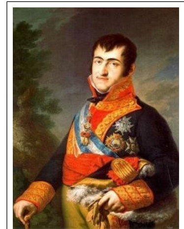
Fernando VII van Spanje De Verrader

De zoon van Carlos IV, Fernando VII van Spanje, zat in 1808 enkele maanden op de troon en vervolgens van 1814 tot 1833. Zijn twee bijnamen luiden El Deseado en El Rey Felón , respectievelijk De Gewenste en De Verrader. Als jong vorst was deze koning zeer geliefd bij het volk. Hij was de eerste koning na het verdrijven van de gehate José Bonaparte. Al snel na zijn kroning ontwikkelde hij zich echter tot een absolutistisch vorst die zelfs de Grondwet van Cádiz afschafte. De Verrader slaat zowel op het hem door zijn tegenstander Manuel de Godoy aangerekende hoogverraad, waarvoor hij in 1807 gearresteerd werd, als op het verraad van zijn medeplichtigen dat hij daarna volgens de kroniek pleegde. Zo kan het bij koningen uit het verleden verkeren.