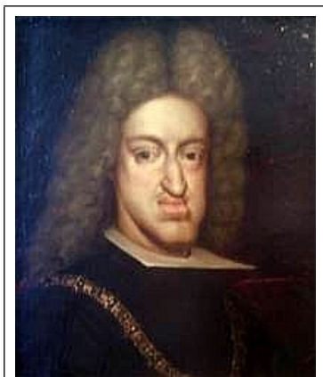
Carlos II van Spanje De Behekste

Ook beklagenswaardig was Koning Carlos II, die in naam over Spanje, de Zuidelijke Nederlanden, Napels en Sicilië regeerde van 1665 tot 1700, maar in feite niet tot regeren in staat was. Hij werd El Hechizado genoemd, wat in het Nederlands vertaald werd als De Behekste. Hij was namelijk zowel geestelijk als lichamelijk ernstig gehandicapt, hoogstwaarschijnlijk tengevolge van degeneratie door inteelt binnen zijn familie, de Habsburgers, maar volgens het geloof van die tijd door beheksing. Tevergeefs traden vele exorcisten aan. De arme Carlos werd tweemaal