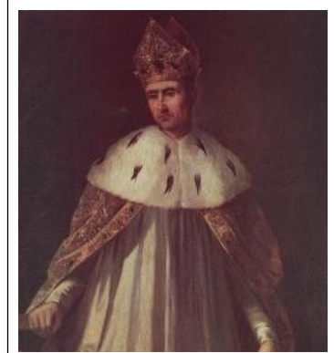
Ramiro II van Aragón De Monnik

De bijnaam van Ramiro II (1134-1157) van Aragón luidde El Monje , De Monnik. Deze koning werd op zeer jeugdige leeftijd toevertrouwd aan een klooster in Zuid-Frankrijk, werd abt van een klooster in Huesca en later bisschop. Zijn broer, koning Alfonso I, legde vast dat na zijn dood het koninkrijk toe zou komen aan enkele militaire ordes, maar