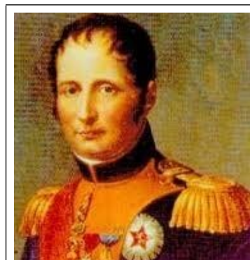
José Bonaparte Joop het Drankorgel

Na de verovering van Spanje door Frankrijk in 1808 werd José Bonaparte, de oudere broer van Napoleon, op de troon van Spanje gezet. Zijn regeerperiode duurde slechts vijf jaar en de Spanjaarden hadden niet veel met hem op, maar José Bonaparte bouwde wel een reputatie op als Pepe Botella , volgens sommige bronnen omdat hij accijns hief op wijn, maar meer waarschijnlijk omdat hij die zelf best lustte. In het Nederlands is deze bijnaam niet doorgedrongen, maar de betekenis is dus ongeveer 'Joop het Drankorgel'.