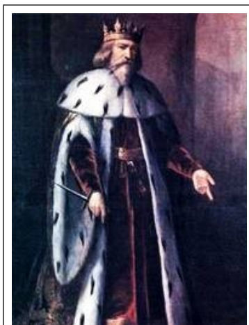
Pedro IV van Aragón Pedro met de Ponjaard

Hiervóór werden al enkele koningen genoemd die twee of meer bijnamen kregen toegemeten. Dikwijls was dat afhankelijk van de positie of het perspectief van de toekenners. Ook werd in de loop der geschiedenis in de annalen soms de ene kant, dan weer de andere kant van een persoon meer benadrukt.