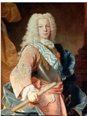
Fernando VI van Spanje De Rechtvaardige

Martín I van Aragón regeerde van 1356 tot 1410 en werd beschouwd als een uitermate beschaafd en intelligent man, een typische Renaissancekoning, en daarom el Humano genoemd. In het Nederlands werd de bijnaam vertaald als De Menselijke, nu misschien liever te vertalen als De Humanist. Omdat zijn oudste zoon ook Martín heette, kreeg hijzelf later als tweede bijnaam El Viejo , De Oude.