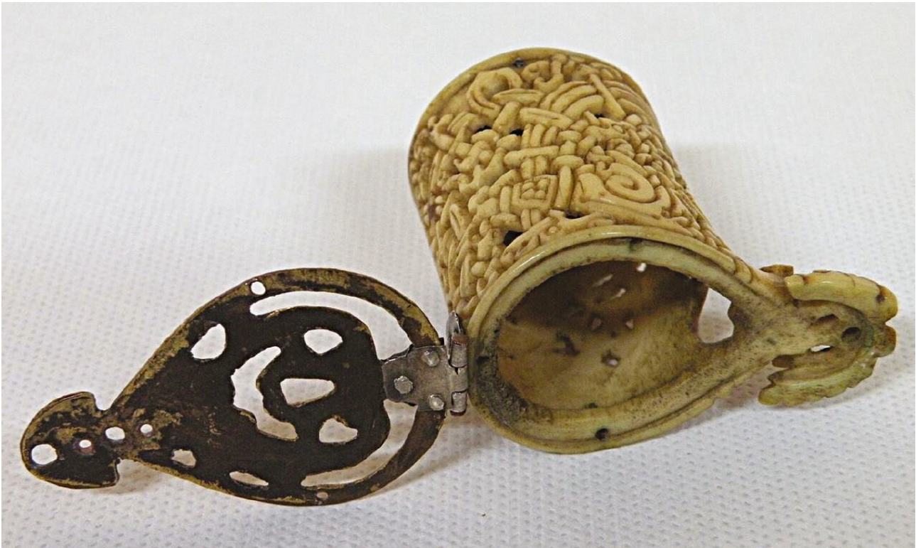
La Cajita de San Isidoro

Dit doosje is niet afkomstig uit een graf of andere archeologische vindplaats, maar gedurende eeuwen in gebruik geweest om uiteindelijk terecht te komen in het Museo de la Colegiata de San Isidoro te León.